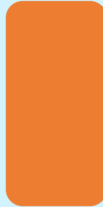
Verminderen van retouren